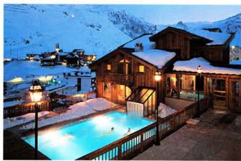
BO I BACKEN! HOTELL VILLAGE MONTANA, TIGNES