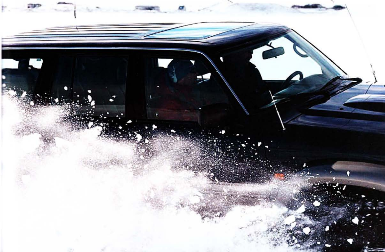
Under: En stor bil med stora hjul i Myvatn, 3000 superjeeps åker runt på Island och vi fick nöjet att prova en av dem.