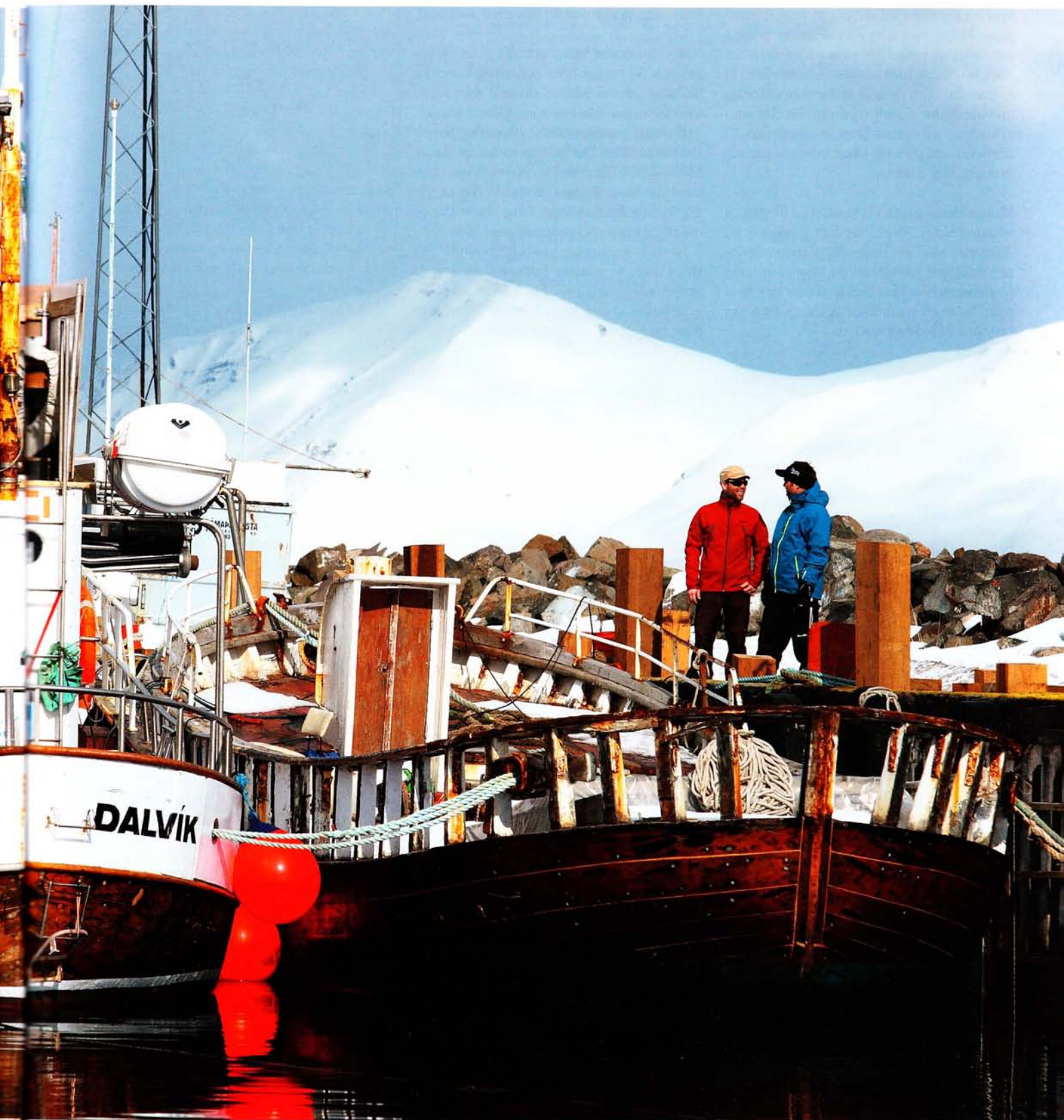
Fiskebátar í Dalvík.